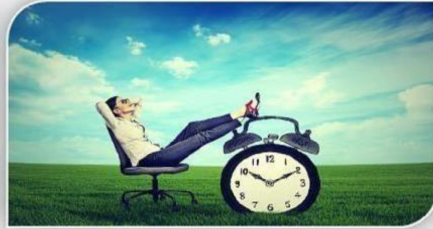
समय की आजादी