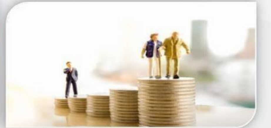
खुशहाल वृद्धा अवस्था