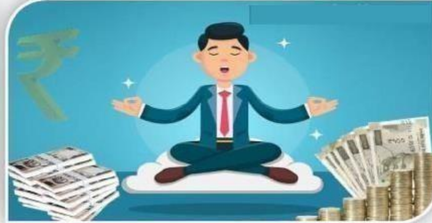
मन चाहा पैसा