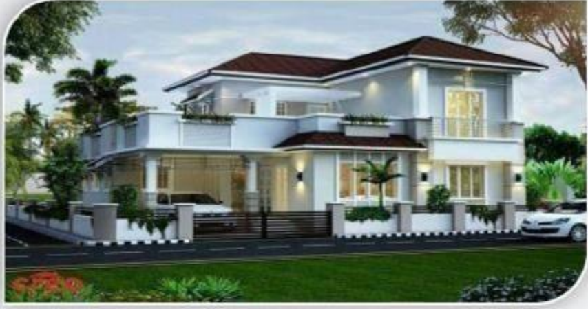
सपनो का घर