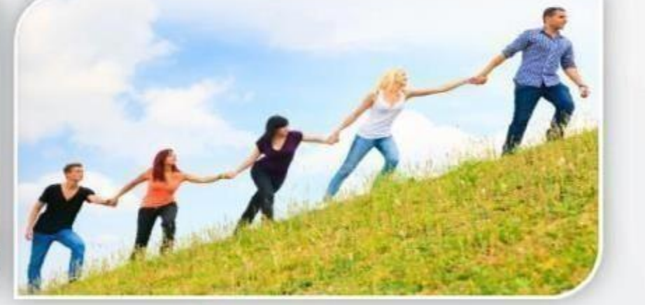
लोगों की मदद