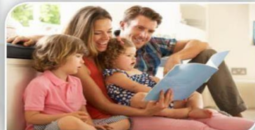
परिवार के साथ समय