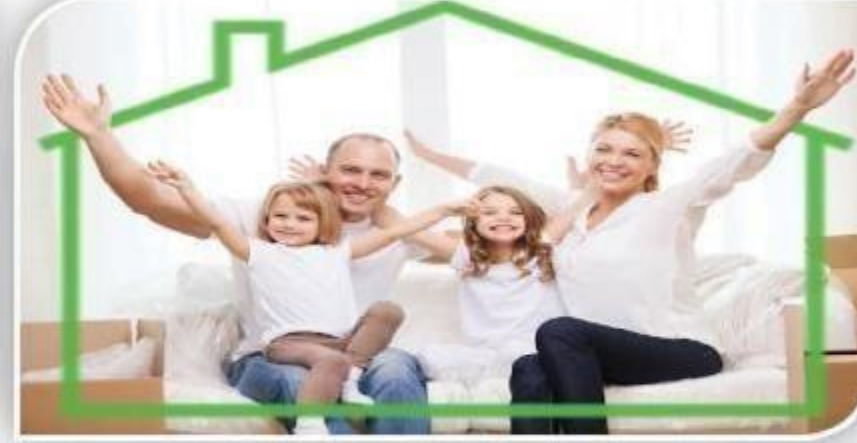
परिवार की सुरक्षा