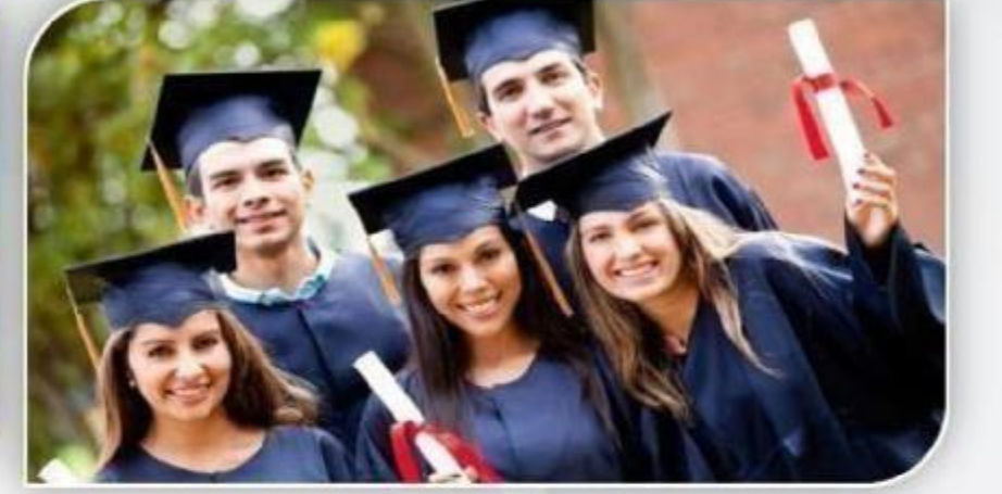
बच्चों की शिक्षा